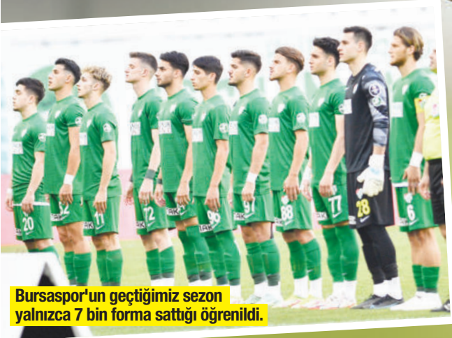
Bursaspor'un geçtiğimiz sezon yalnızca 7 bin forma sattığı öğrenildi.